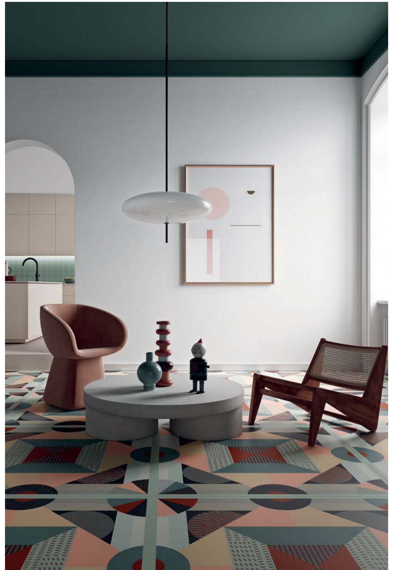
One_08 120x120 / Base_00 120x120