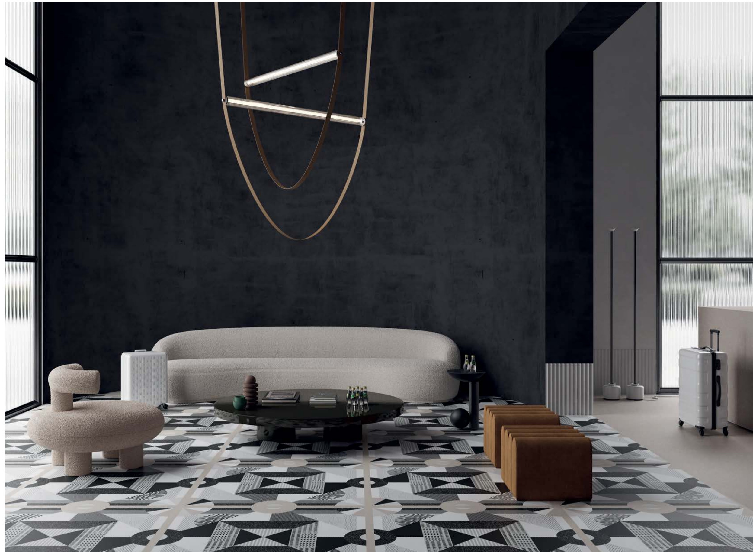
Desk Base_00 120x120 - Floor One_01 / Base_00 120x120