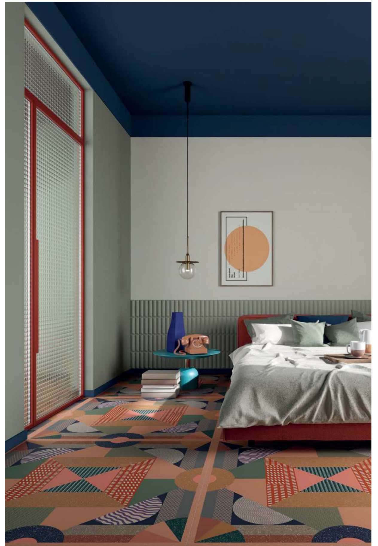
Wall Biscuit Dune Salvia 5x20 - Floor One_03 120x120